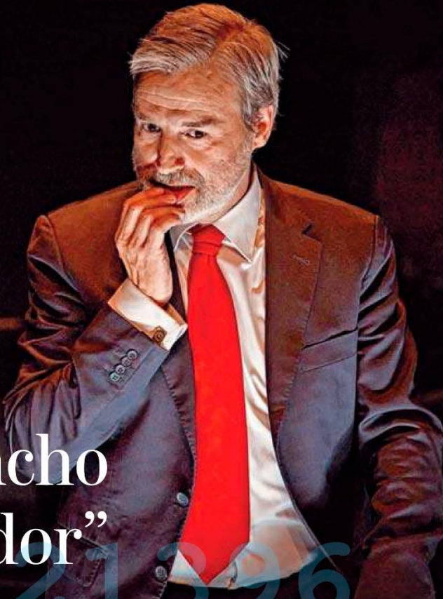
Alberto San Juan, en una escena de la comedia musical Macho grita , escrita y dirigida por él mismo.